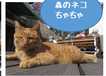
森のネコ ちゃちゃ